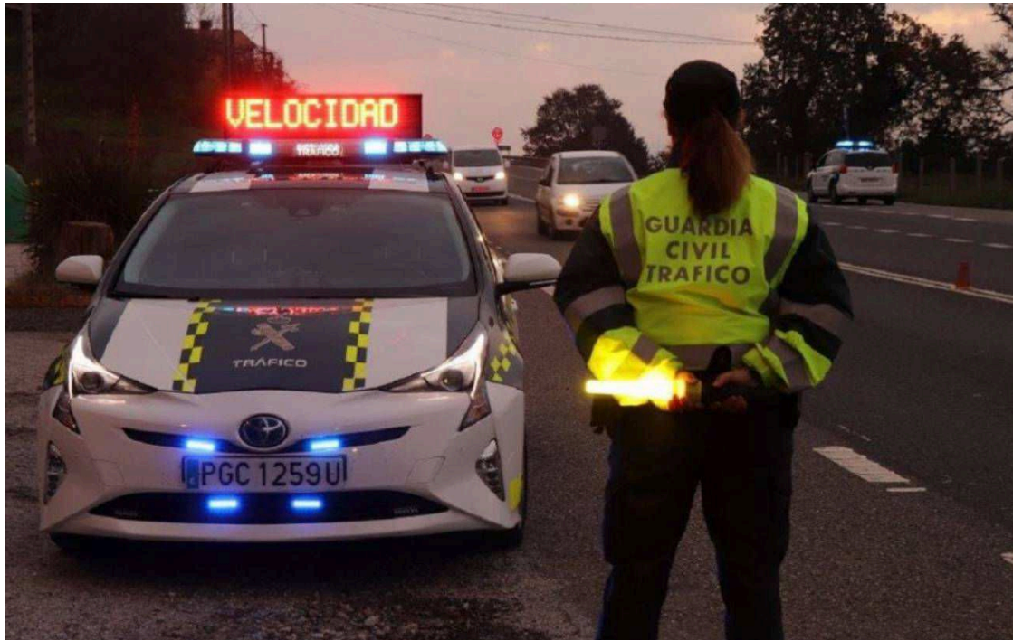
Descubre las infracciones más comunes.

La Dirección General de Tráfico (DGT) ha compartido, a través de su cuenta de Twitter, las principales infracciones que cometen los conductores y conductoras al volante. Todo ello con el objetivo de alertar sobre los distintos peligros a los que nos enfrentamos en carretera y reducir la cifra de muertos tanto en vías convencionales como en las vías urbanas de las ciudades.