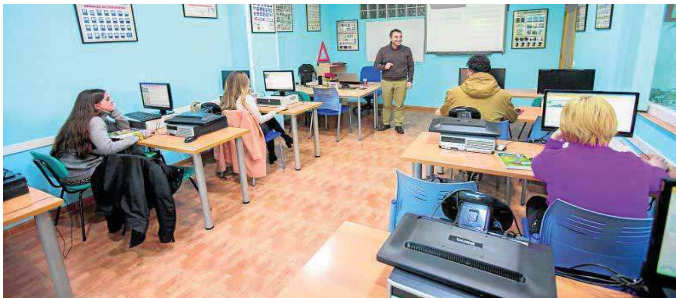
Una clase teórica en una autoescuela de la provincia de Granada. ALFREDO AGUILAR