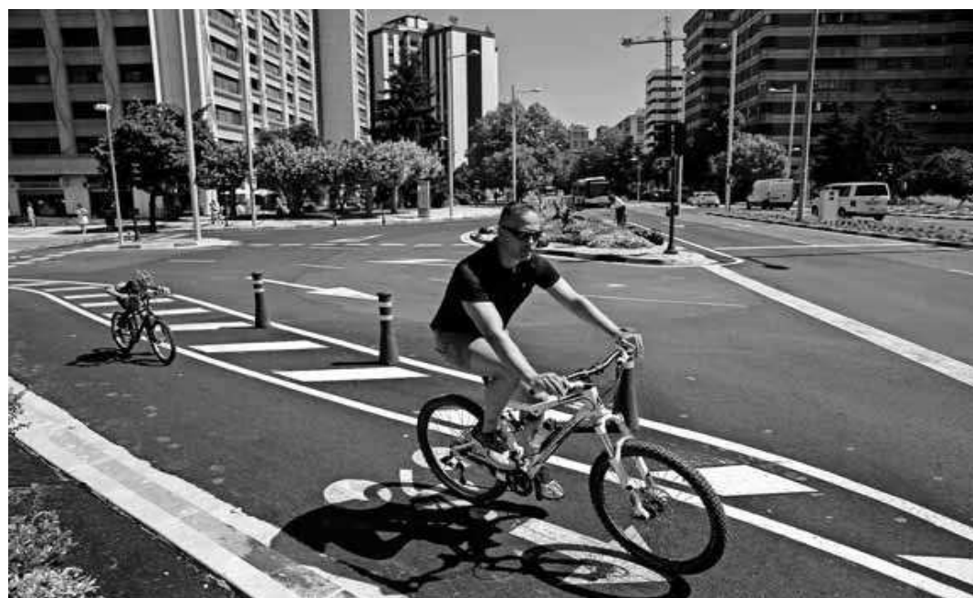
Un hombre y un niño circulan por el carril bici de la avenida de Pío XII.

Otro de los aspectos encaminado a prevenir o resolver los robos de bicicletas es el registro de imágenes que ha habilitado el Ayuntamiento y que se puede consultar en la página web municipal www.pamplona.es , en el apartado de Seguridad Ciudad. En el mismo apartado, hay un enlace con consejos para evitar robos (atar siempre la bici con un candado en 'U' y a un elemento rígido o aparcabicis y guardar la factura de compra).