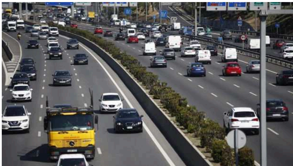
Tráfico en una de las carreteras que rodean Madrid.