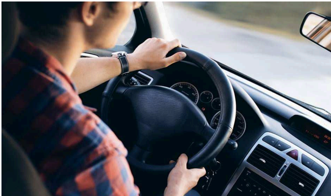
Imagen de un joven al volante.

Conducir sin respetar las normas de circulación puede suponer, además de una sanción económica, la pérdida de puntos, hasta un máximo de 6 por infracción