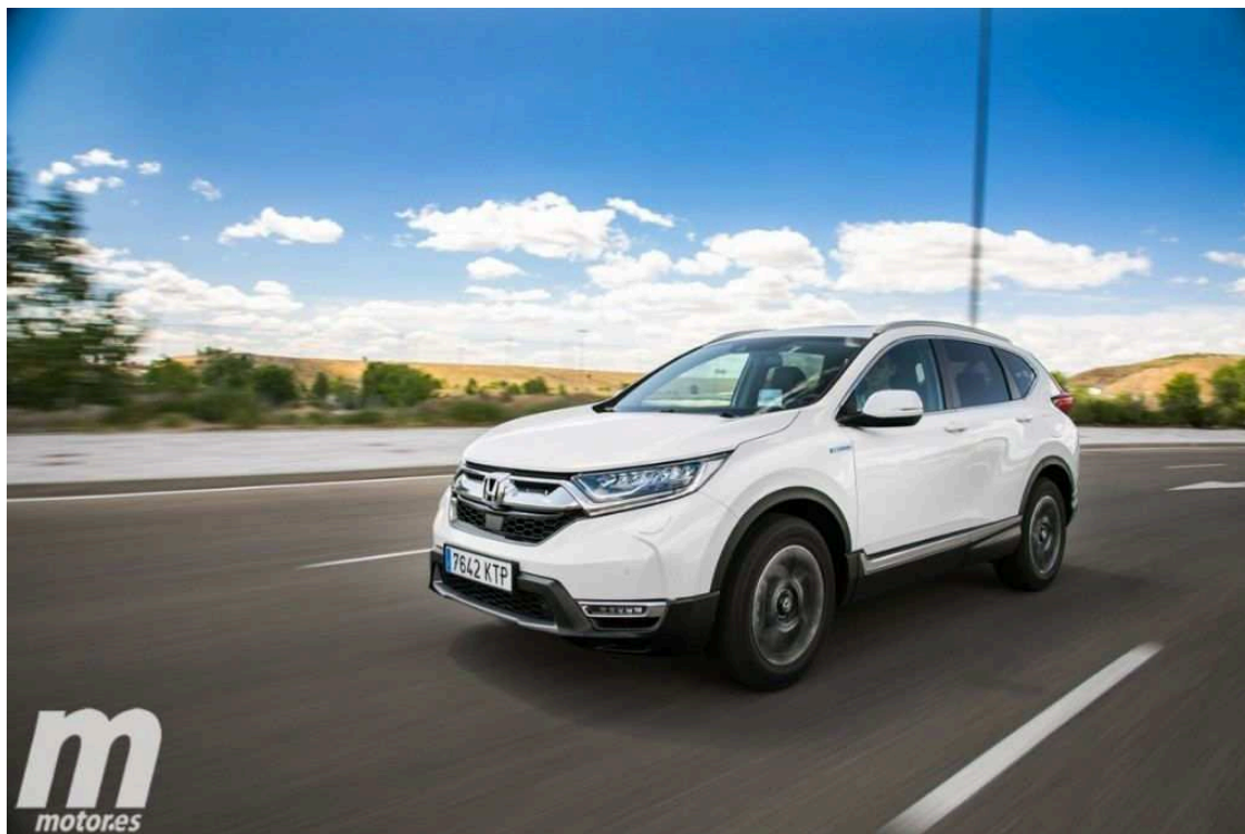
Consejos y recomendaciones para afrontar la operación salida de verano.

La DGT ( Dirección General de Tráfico ) estima que durante los primeros días del mes de agosto de 2019 se producirán más de 47 millones de desplazamientos en vehículo. Hoy se ha puesto en marcha la denominada Operación Salida de primeros de agosto y que se extenderá hasta el primer fin de semana del mes estival por excelencia en España. Carreteras abarrotadas, ciudades que quedan cuasi desiertas para que otras localidades dupliquen o tripliquen sus poblaciones.