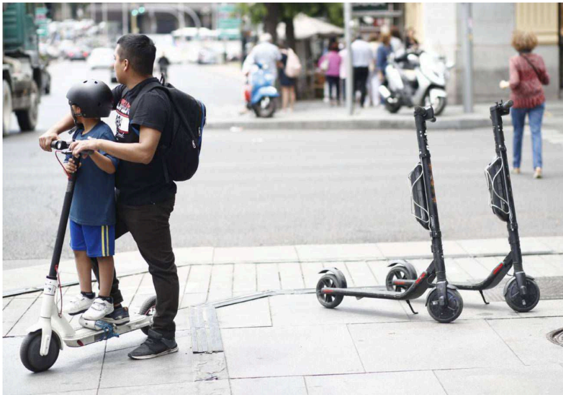
Un niño y un adulto montando en un patinete eléctrico en la calle Goya de Madrid. /

31 de julio es sinónimo de 'Operación salida' para muchos ciudadanos que se van de vacaciones en el mes de agosto. No solo en tren o avión, la carretera siempre es protagonista en un día como hoy.