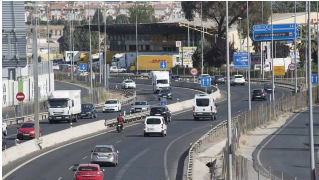
Los granadinos ya abandonan la capital en busca de su destino vacacional en agosto

Los granadinos ya abandonan la capital en busca de su destino vacacional en agosto