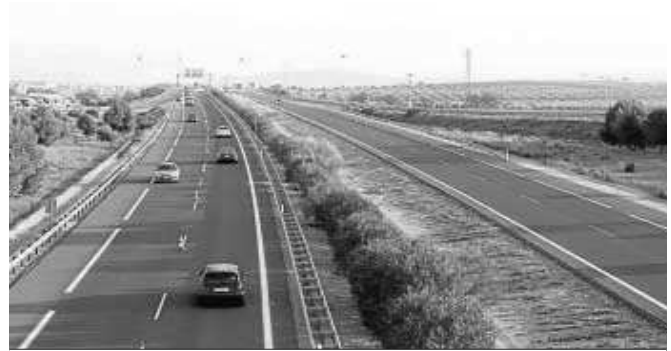
Será la primera vez que se utilicen drones como radares de vigilancia. A. CÁMARA