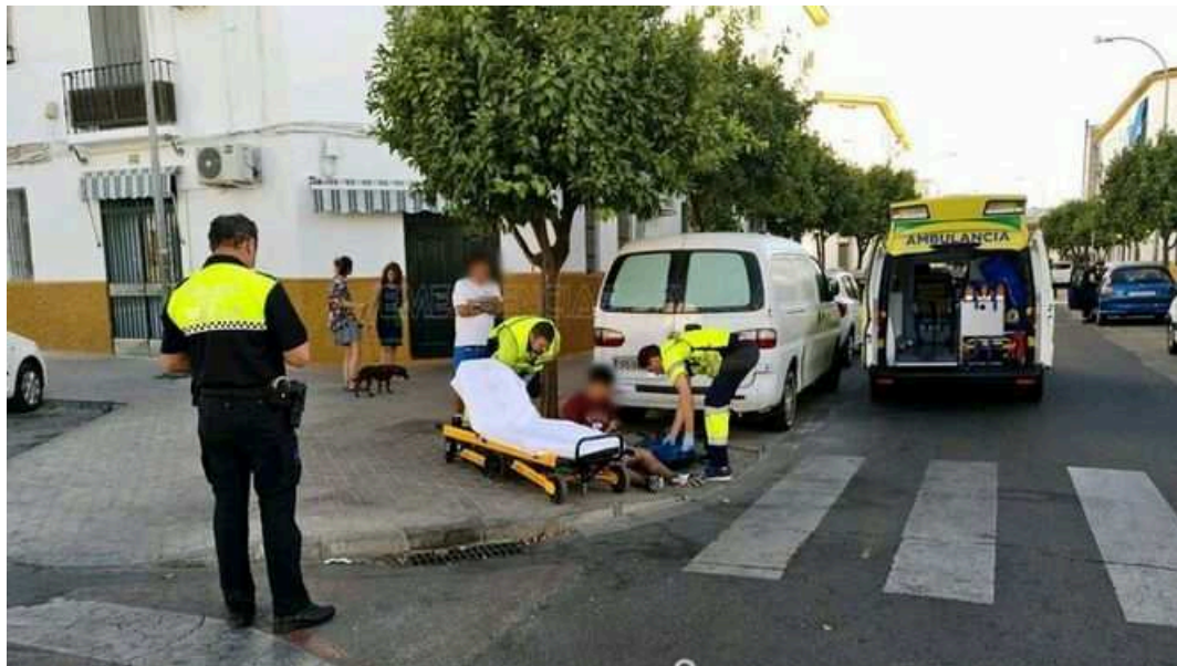
La Policía Local y los efectivos sanitarios atienden al herido.

La Policía Local y los efectivos sanitarios atienden al herido.