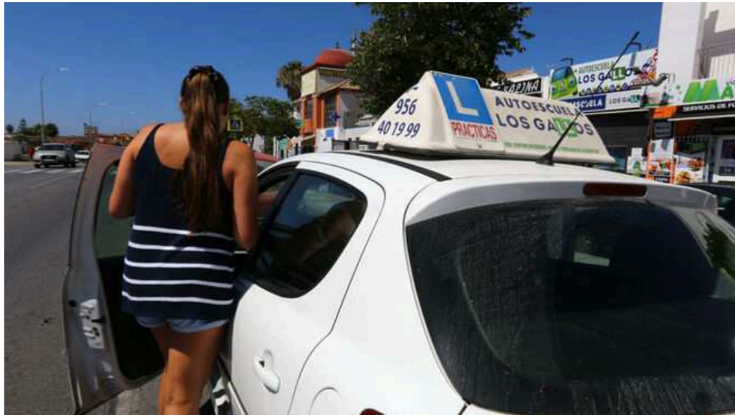
Una alumna se dispone a dar una clase en una autoescuela.

Una alumna se dispone a dar una clase en una autoescuela.