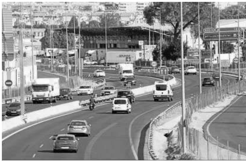
Los granadinos ya abandonan la capital en busca de su destino vacacional en agosto. CARLOS GIL

Durante todo el mes de agosto, la DGT prevé que las carreteras andaluzas sumen un total de 10,34 millones de desplazamientos de largo recorrido, un 2,54% más que los contabilizados en el mismo mes de 2018.