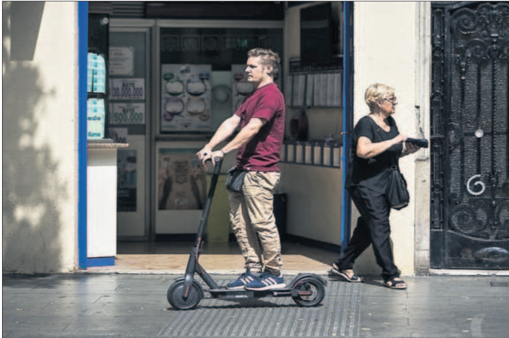
Un hombre circula con un patinete eléctrico por la acera en el distrito barcelonés de Sants.