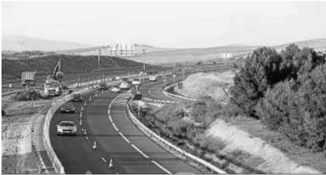
La Operación Salida va a ser escalonada este año al no coincidir de pleno con el fin de semana.