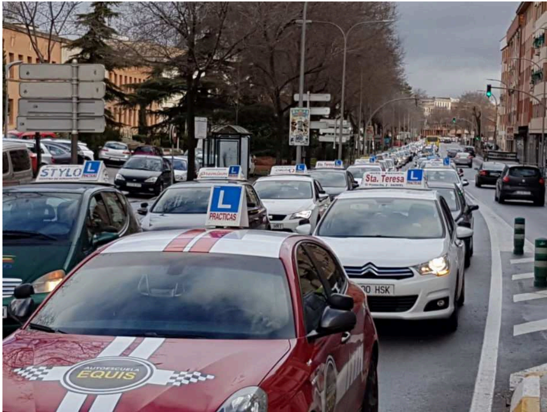
Vehículos de las autoescuelas de Ciudad Real en la ronda

La nueva directiva de la Asociación Provincial de Autoescuelas se queja de la falta de examinadores de la Jefatura Provincial de Tráfico, reclama un calendario de exámenes y se queja de que se tarde más de 20 días en examinar del práctico al aspirante