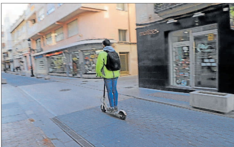
Un hombre circula en patinete eléctrico ayer por la calle Sant Pasqual de Gandia.

A través de un comunicado, el Ayuntamiento gandiense ha reclamado a la Dirección General de Tráfico (DGT) que actúe y ordene normas para la circulación de esos vehículos, dado que el problema, obviamente, se está dando en toda España. «Como la DGT no ha hecho nada, estamos totalmente desprotegidos. No hay normativa nacional», indica el Gobierno local gandiense, y añade que, en el caso del accidente del lunes, la mujer que conducía el patinete que golpeó a la anciana infringía al menos una norma, dado que la acompañaba su hija cuando está prohibido que en ese