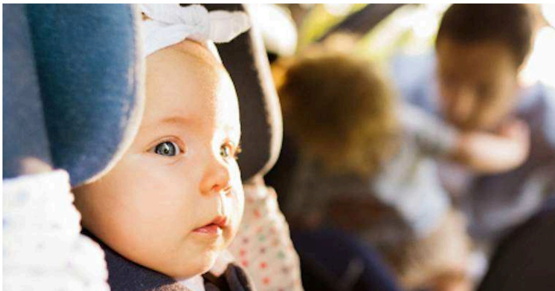
Queda camino por recorrer en la seguridad infantil

Respecto a los niños, durante los siete días de vigilancia los agentes detectaron a 262 menores de edad y de estatura igual o menor a 135 cm, viajando sin ningún tipo de dispositivo de seguridad. Concretamente, 62 de ellos iban en el asiento delantero y otros 200 en los asientos traseros.