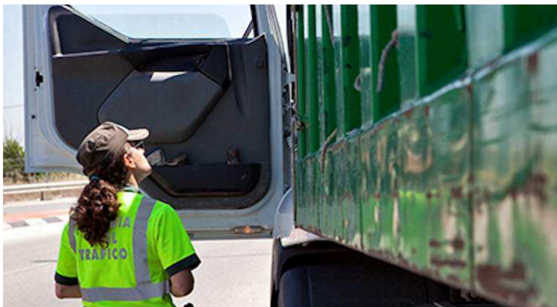
Los camiones ruedan más horas de las permitidas

En una sola semana, 89 conductores (16 camiones y 73 furgonetas) dieron positivo en alcohol y 40 positivo en drogas (32 conductores de furgonetas y 8 de camiones). En lo que respecta al cinturón de seguridad, otro de los pilares básicos de la seguridad vial, 126 usuarios de camiones, 12 de autobús y 517 de furgonetas han sido denunciados por no hacer uso de dicho dispositivo de seguridad. En el caso de la velocidad, 1.044 conductores de estos tipos de vehículos circulaban a velocidades superiores a la permitida. De los 1.044, 957 eran conductores de furgonetas.